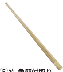
⑤ 竹 角節付取り 青竹 菜箸 33cm