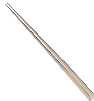
③ 竹 オトリ箸