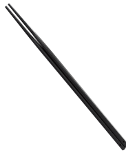
⑩ シリコン コンビ菜箸 ブラック

全長:300 材質:本体/ナイロン66樹脂(耐熱200℃) 先端/シリコン樹脂(耐熱300℃) ●先端がシリコン樹脂で焦げにくく、滑りにくい。