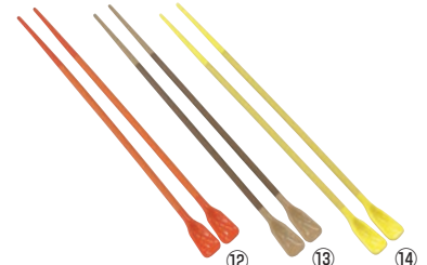
⑫ ⑬ ⑭