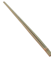
④ 国産青竹製 菜箸